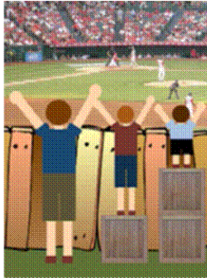
La situation est corrigée parce que l'on a pris en compte les réalités différentes