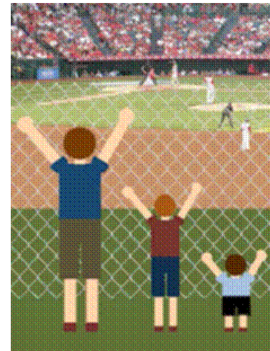
Ici on a enlevé l'élément structurel qui empêchait une vision égale pour tous.